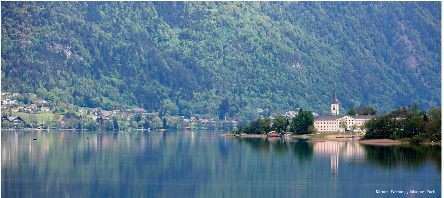
Kärnten Werbung / Johannes Puch