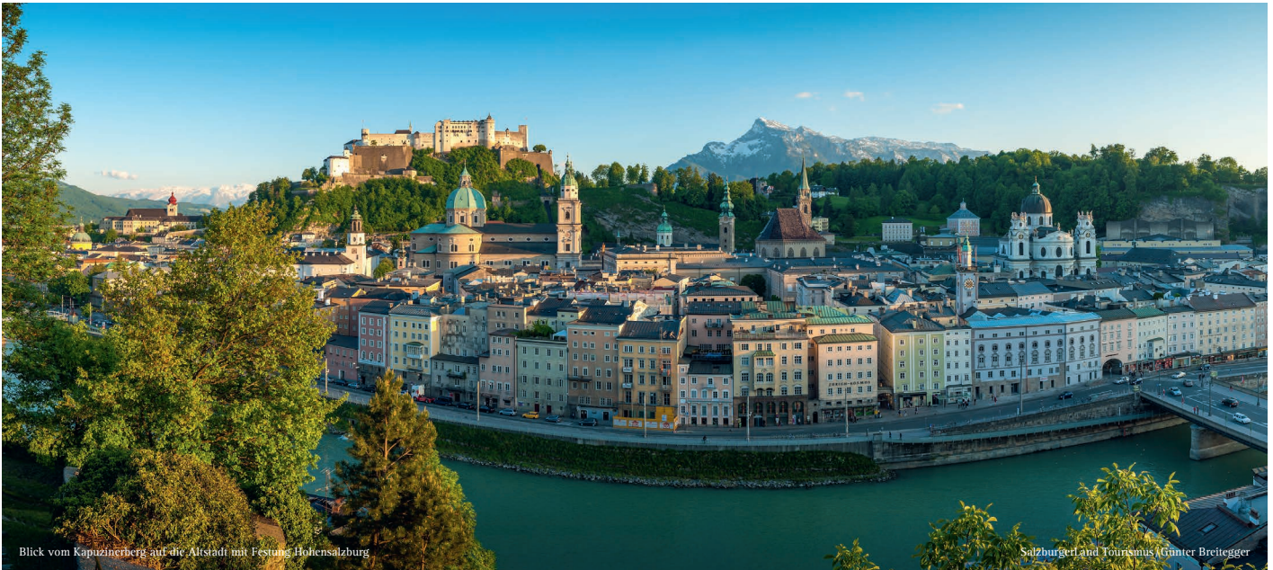
Blick vom Kapuzinerberg auf die Altstadt mit Festung Hohensalzburg