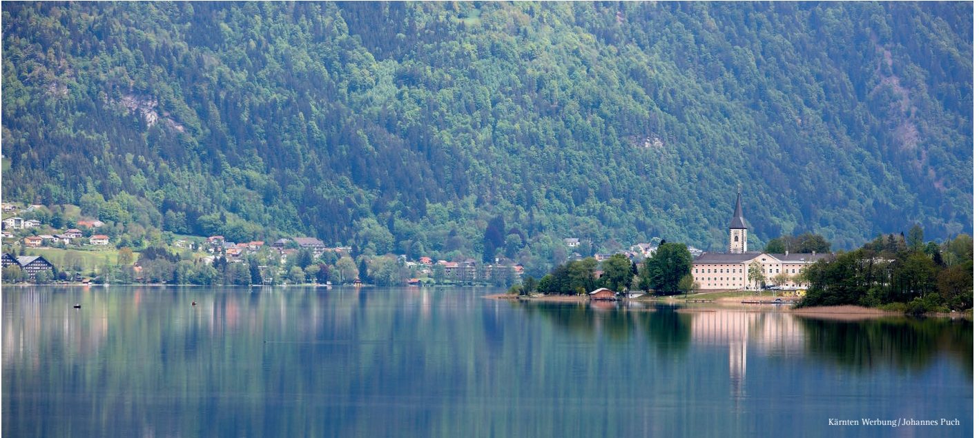
Kärnten Werbung / Johannes Puch