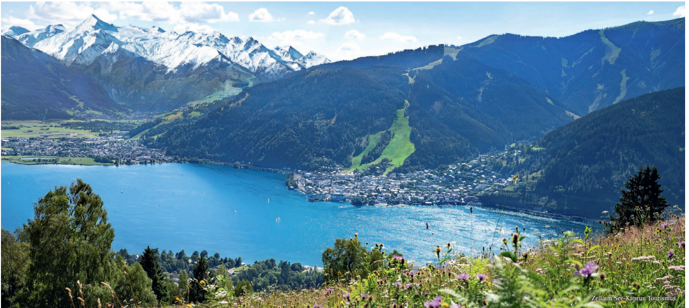
Zell am See-Kaprun Tourismus